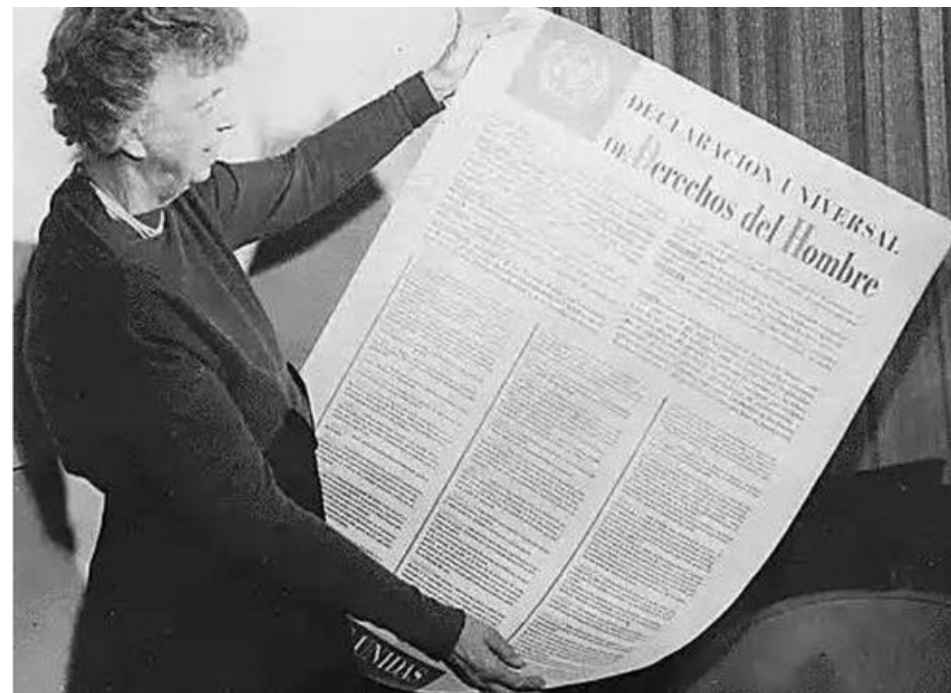
Элеонора Рузвельт с текстом Декларации (1948)