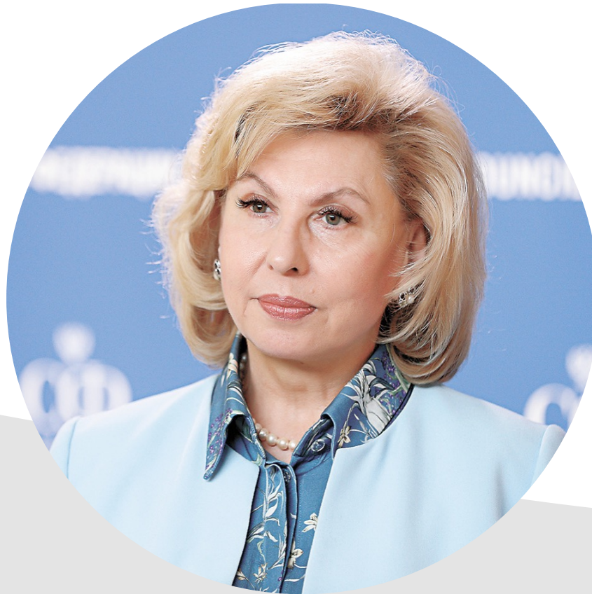
Татьяна Николаевна Москалькова