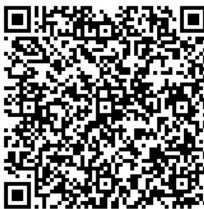
Рисунок 7 — Сценарий тематической викторины с примерами вопросов

Несмотря на игровой формат, ключевая цель мероприятия – профилактическая. Поэтому особый акцент стоит сделать именно на объявлении правильных ответов, поясняя их и отвечая на все возникающие вопросы (см. рисунок 7).