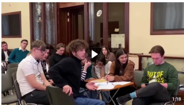
Дебаты «Идеология радикальных организаций» 1 888 просмотров

В рамках дебатов можно: развенчивать мифы, декларируемые представителями радикальных идеологий для вербовки; развивать навыки критического мышления и ведения дискуссии; формировать в целом антитеррористическое сознание и активную гражданскую позицию. Рекомендуется для мероприятия вовлекать не более 20 человек (см. рисунок 5).