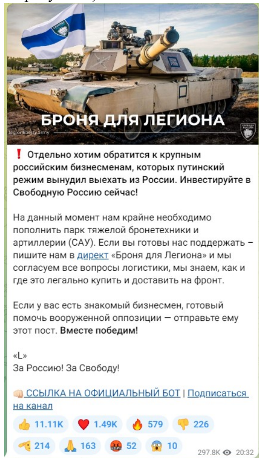
Рисунок 3 — Скриншот телеграм-канала легиона «Свобода России» с призывом к финансированию

4) структурное подразделение Минобороны Украины легион «Свобода России» (признан террористической организацией по решению Верховного Суда Российской Федерации от 16.03.2023 г. № АКПИ23-101С). Цель организации заключается в подрыве государственности, территориальной целостности и конституционных основ нашей страны. Немалая часть боевиков указанных военизированных формирований является праворадикалами и неонацистами по своим идеологическим убеждениям. Опасность данных организаций заключается, с одной стороны, в соучастии в убийстве российских военнослужащих в зоне СВО, с другой стороны, в попытках вовлечения российской молодежи в противоправную деятельность: поджоги военных комиссариатов, нападения на правоохранительные органы, совершение диверсий, а также финансирование украинских вооруженных сил (ВСУ) (см. рисунок 3).