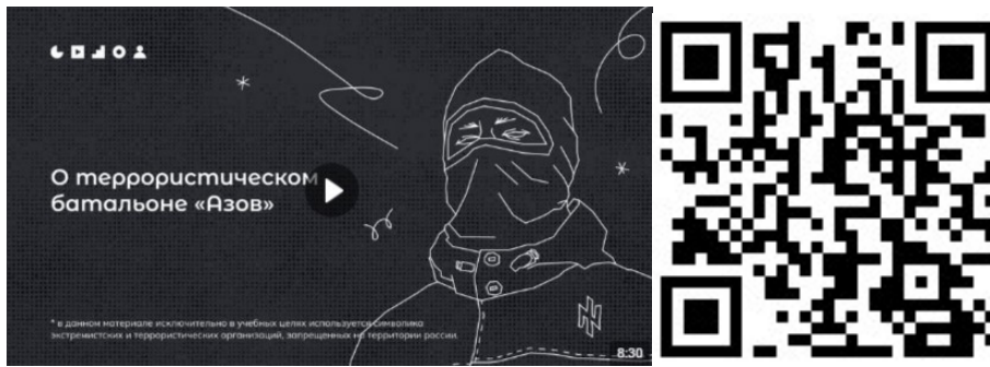
Рисунок 2 – Видеоролик, разъясняющий причины признания организации террористической

4) структурное подразделение Минобороны Украины легион «Свобода России» (признан террористической организацией по решению Верховного Суда Российской Федерации от 16.03.2023 г. № АКПИ23-101С). Цель организации заключается в подрыве государственности, территориальной целостности и конституционных основ нашей страны. Немалая часть боевиков указанных военизированных формирований является праворадикалами и неонацистами по своим идеологическим убеждениям. Опасность данных организаций заключается, с одной стороны, в соучастии в убийстве российских военнослужащих в зоне СВО, с другой стороны, в попытках вовлечения российской молодежи в противоправную деятельность: поджоги военных комиссариатов, нападения на правоохранительные органы, совершение диверсий, а также финансирование украинских вооруженных сил (ВСУ) (см. рисунок 3).