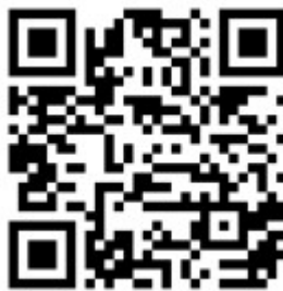
Рисунок 6 — Рекомендации по проведению кинопоказов в профилактике

Среди фильмов по тематике противодействия терроризму можно использовать следующие фильмы: «Беслан. Память» (Россия, 2014 г., возрастное ограничение: 12+), «Кавказский пленник» (Россия, 1996 г., возрастное ограничение: 18+), «Я не террорист» (Узбекистан, 2021 г., возрастное ограничение: 18+), «Отель Мумбаи: противостояние» (США, Австралия, 2018 г., возрастное ограничение: 18+) и т.д.