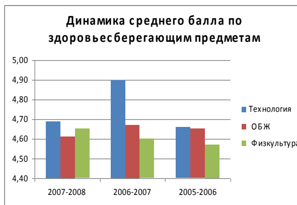
Динамика среднего балла по здоровьесберегающим предметам